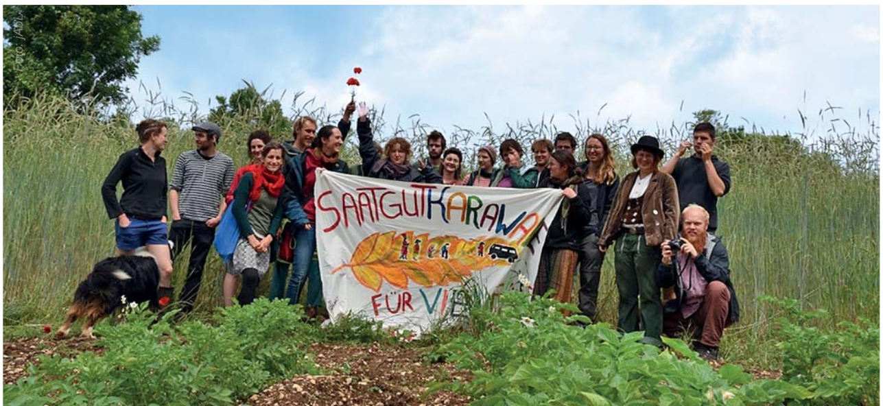
Die Teilnehmer der Saatgutkarawane vor Vielfaltsroggen auf einem französischen Hof im Département Rhône-Alpes

Wir, die junge Arbeitsgemeinschaft bäuerliche Landwirtschaft, werden uns auch in Zukunft für Vernetzung, Bildung und Unabhängigkeit einsetzen. Wir freuen uns darauf, noch mehr mit Menschen aus handwerklichen und verarbeitenden Bereichen und Verbraucherinnen und Verbrauchern zusammen zu träumen, zu arbeiten und zu kämpfen! ■