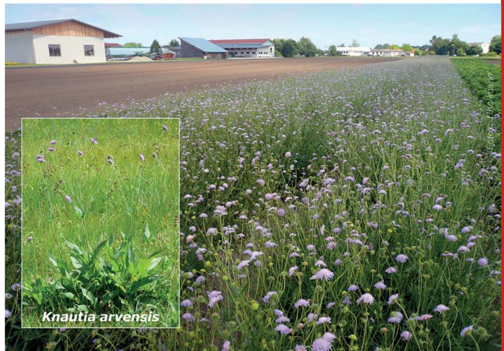
Die Acker-Witwenblume zeigt ausgeprägte genetische Unterschiede zwischen Nord- und Süddeutschland und zusätzlich eine deutliche regionale Anpassung. Sie wird wie viele andere Arten auf dem Regio-Saatgut-Betrieb von Johann Krimmer bei Freising angebaut.

Wir haben dazu sieben häufige Grünlandarten aus acht der 22 deutschen Herkunftsgebiete verwendet. Entsprechendes Saatgut wurde bei der Firma Rieger-Hofmann, Blaufelden, bestellt, die Pflanzen standardisiert in Gewächshäusern herangezogen und in einheitliche Töpfe und mit Standarderde in Versuchsanlagen im Freiland in Freising, Tübingen, Münster und Halle ausgepflanzt. Innerhalb eines Sommers konnten Daten u. a. zur Biomasse der Pflanzen, der Blütenanzahl und ihrer zeitlichen Entwicklung gewonnen werden. Zusätzlich wurden an ausgewählten Arten die Besiedelung der Blütenköpfe durch parasitische Insekten und