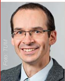
Prof. Dr. Johannes Kollmann

100 landwirtschaftliche Betriebe im Haupt- und Nebenerwerb Samen und Pflanzen krautiger Arten produzieren. Diese Betriebe zeigen ein großes Engagement bei der anspruchsvollen Methodik des Anbaus, der Aufbereitung und Vermarktung von Wildpflanzen-Saatgut. Zur Qualitätssicherung wurden entsprechende Zertifizierungssysteme eingeführt, v. a. RegioZert® und VWW-Regio-saaten®. Die Zertifizierung beruht auf einem System mit 22 Herkunftsregionen in Deutschland, die nach naturräumlichen und biogeografischen Argumenten ausgeschieden wurden. Aufgrund der derzeitigen Nachfrage werden diese Regionen zu acht Produktionsräumen zusammengefasst, innerhalb derer Pflanzenmaterial zur Produktion und zur Anwendung ausgetauscht werden darf.