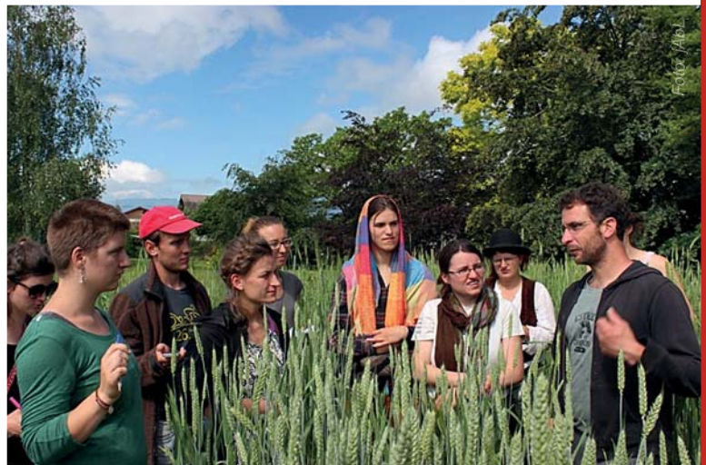
Kornfeld mit verschiedenen Sorten auf einem der Höfe des Réseau Sémences Paysannes in Frankreich