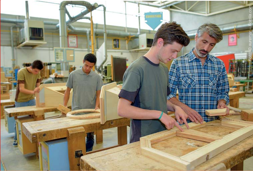
Mangelnde Transparenz der regionalen Unternehmenslandschaft erschwert es Jugendlichen, passenden Ausbildungsbetriebe zu finden.

schulreife keine weiterführenden Bildungsangebote im Hochschulbereich geboten werden. Die duale Ausbildung wird von Abiturient/-innen weiterhin als Sackgasse gesehen, die eine weitere berufliche Karriere ausschließt.