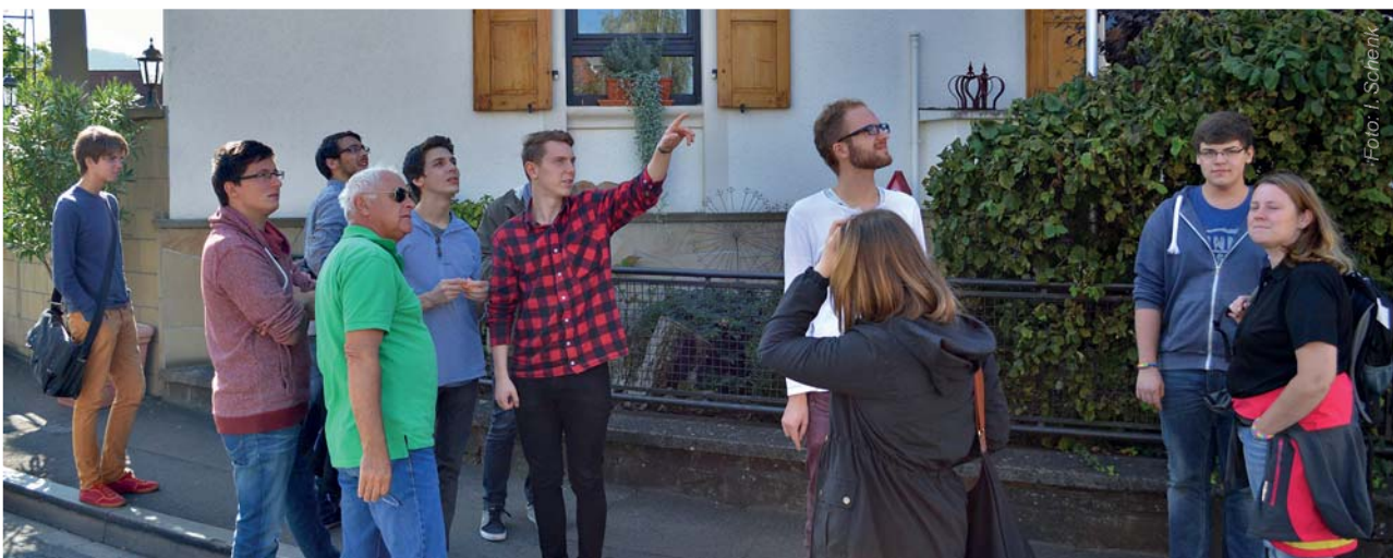
Was fällt auf? Dorfbegehungen schärfen den Blick auf den Heimatort.

In Kooperation mit der LEADER-Region Pfälzerwald plus wird das Dorfraum-Pionier-Projekt in der aktuellen Förderperiode für die Region Pirmasens-Pfälzerwald neu beantragt. Zugleich wird eine Weiterführung des Projekts in der LEADER-Region Donnersberger und Lautrer Land beantragt, das nun über einen Zeitraum von 4-5 Jahren laufen soll. Die zuvor als Dorfraum-Pioniere qualifizierten Jugendlichen sollen nun in ihren Orten als „Dorfentwickler“ aktiv werden. Zusätzlich werden neue Dorfraum-Pioniere ausgebildet. Mit Blick auf die regionale Zukunft wird so eine neue Generation ausgebildet, die mit Methoden der Dorfraumanalyse und Dorfentwicklung vertraut ist, im Idealfall ins Dorf zurückkehrt und künftig die lokale Politik und das Dorf mitgestaltet. ■