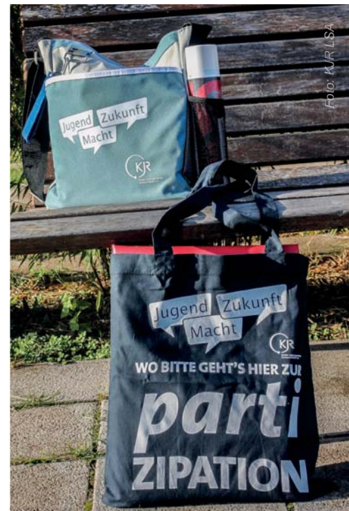
Die Beteiligungstaschen bieten praxisorientierte Anregungen für Partizipation.

Mit den ebenfalls von der Stiftung Demokratische Jugend geförderten Beteiligungstaschen mit Informationsmaterial unterbreitet Jugend Macht Zukunft gezielt ein niedrigschwelliges Angebot, das junge Menschen proaktiv dazu anregt, sich selbstständig über ihre Lebenssituation, Interessen und Bedarfe Gedanken zu machen und diese anschließend nach außen zu tragen und sich so in gesellschaftliche Prozesse einzumischen. Die Taschen bieten eine inhaltliche und methodische Bereicherung der alltäglichen Arbeit in Jugendverbänden, Jugendclubs, Schulklassen und Jugendgruppen vor Ort.