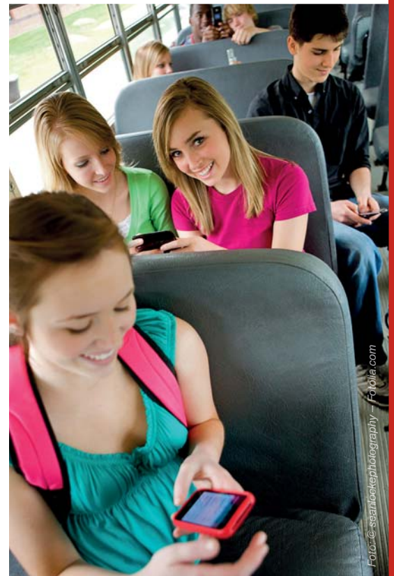
Internet-Zugang u. a. auch durch Hot-Spots in Schulbussen

Der Übergang von der Schule in die Arbeitswelt ist in ländlichen Räumen meist zugleich mit der Entscheidung zu gehen oder zu bleiben verknüpft. Diese ist ein Abwägungsprozess hinsichtlich der individuellen Bedeutsamkeit der sozialen und kulturellen Angebotslage, der Einschätzung der