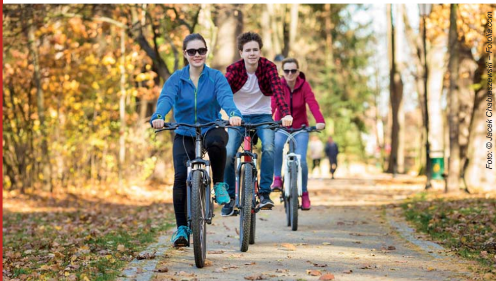
Mehr Unabhängigkeit von den Eltern dank sicherer Radwege

Treff- und Freizeiträume wie Facebook oder WhatsApp ist aufgrund der fehlenden Verfügbarkeit einer schnellen mobilen Internetverbindung (LTE) vielerorts stark eingeschränkt. Oftmals bietet nur die Breitbandverbindung im Elternhaus eine ausreichend gute und stabile Internetverbindung, allerdings ist auch diese trotz deutlicher Verbesserungen im Breitbandausbau nicht für alle Jugendlichen verfügbar.